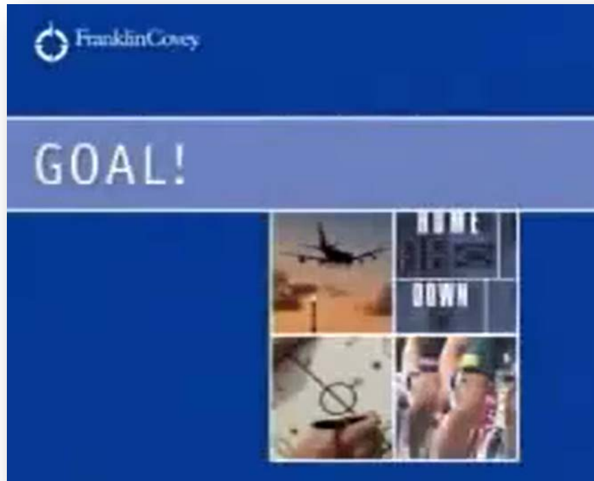
Video MOD1-FMC-VD2 Goal